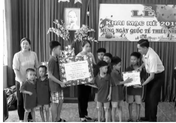
Sở LĐTB và XH trao quà của Bí Thư tỉnh đến các em tại Trung tâm Công tác xã hội nhân ngày quốc tế Thiếu nhi 2019.