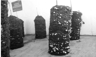
Trồng nấm rơm dạng trụ trong nhà.

Kết quả, sau 10 tháng trồng cùng 2 nghiệm thức thì mô hình trồng nấm rơm dạng trụ thời gian sinh trưởng kết tơ, kết nụ và thu hoạch nhanh hơn mô hình nấm rơm dạng kệ từ 2 đến 04 ngày; năng suất vượt trội hơn gần 3 lần.