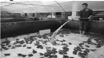
Anh Bảo đang chăm sóc đàn ếch

Ếch sống phụ thuộc nhiều vào điều kiện thời tiết và môi trường nước. Nếu thời tiết mưa nhiều ếch dễ nhiễm các bệnh về đường ruột, mắt và thần kinh. Trời nắng ẩm, môi trường nước sạch là điều kiện thuận lợi giúp ếch sinh trưởng, phát triển khỏe mạnh. Hàng ngày nên thay nước hai lần tạo môi trường sạch cho ếch.