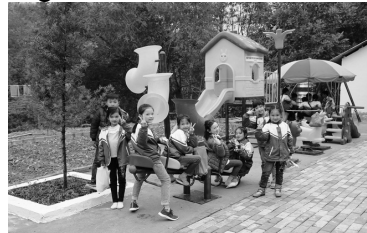
Mọi trẻ em được quan tâm, tạo điều kiện để phát triển toàn diện.

trẻ em được tăng cường. Ủy ban quốc gia về trẻ em thực hiện kiểm tra liên ngành về thực hiện quyền trẻ em tại 5 tỉnh. Thanh tra Bộ LĐ-TB&XH phối hợp với Bộ Tư pháp, Bộ GD&ĐT thực hiện thanh tra liên ngành đối với cơ sở trợ giúp xã hội và cơ sở giáo dục mầm non tại 4 tỉnh, thành phố. Cục Trẻ em thực hiện kiểm tra định kỳ công tác trẻ em tại 9 tỉnh, thành phố. Năm 2020, công tác thanh tra, kiểm tra liên ngành sẽ tập trung vào việc thực hiện trách nhiệm của các bộ, ngành, địa phương, cơ quan, tổ chức về bảo đảm quyền trẻ em và phòng chống bạo lực, xâm hại trẻ em.