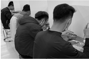
Doanh nghiệp triển khai vách ngăn nhằm hạn chế tiếp xúc, bảo vệ sức khỏe cho người lao động trước dịch bệnh COVID-19.

đoàn các cấp về hoạt động hưởng ứng Tháng hành động về ATVSLĐ năm 2020.